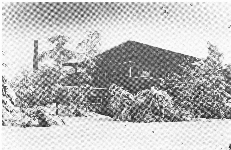
Novi kirurški operacijski trakt u zimskom ruhu, 1955. godine.