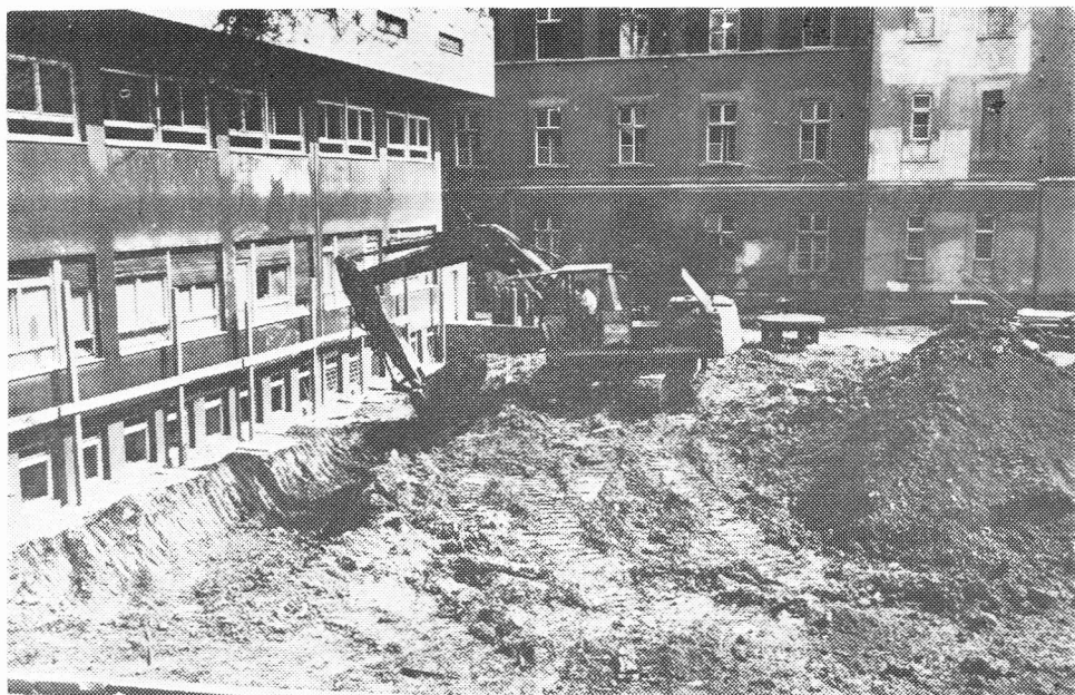
Početak gradnje neurokirurškog trakta, rujna 1984.

kulteta i u njoj se godišnje izvrši više od 3600 velikih kirurških zahvata i znatno više manjih, ambulantnih. Da bi se do tog vremena mogao obaviti sve opsežniji operativni program, u sadašnje smo 4 operacijske dvorane morali uvesti poslije-podnevni operativni program, osim za hitnu kirurgiju i za redovite operacije manjeg rizika, koje ne zahtijevaju ektemporenu biopsiju i intraoperativnu rendgensku kontrolu. Na taj način, broj operativnih zahvata je porastao na više na 2500 u prvih 8 mjeseci 1984. godine, a toliko je prije nekoliko godina bio ukupni godišnji broj operacija. Sada je u Klinici u stalnom radnom odnosu 221 radnik, od čega su 27 kirurzi specijalisti i 2 specijalizanti na određeno vrijeme. U laboratoriju je zaposleno 6 biokemičara i inženjera biokemije, a u Klinici rade 124 osobe od ostalog zdravstvenog osoblja i 52 od pomoćnog osoblja.