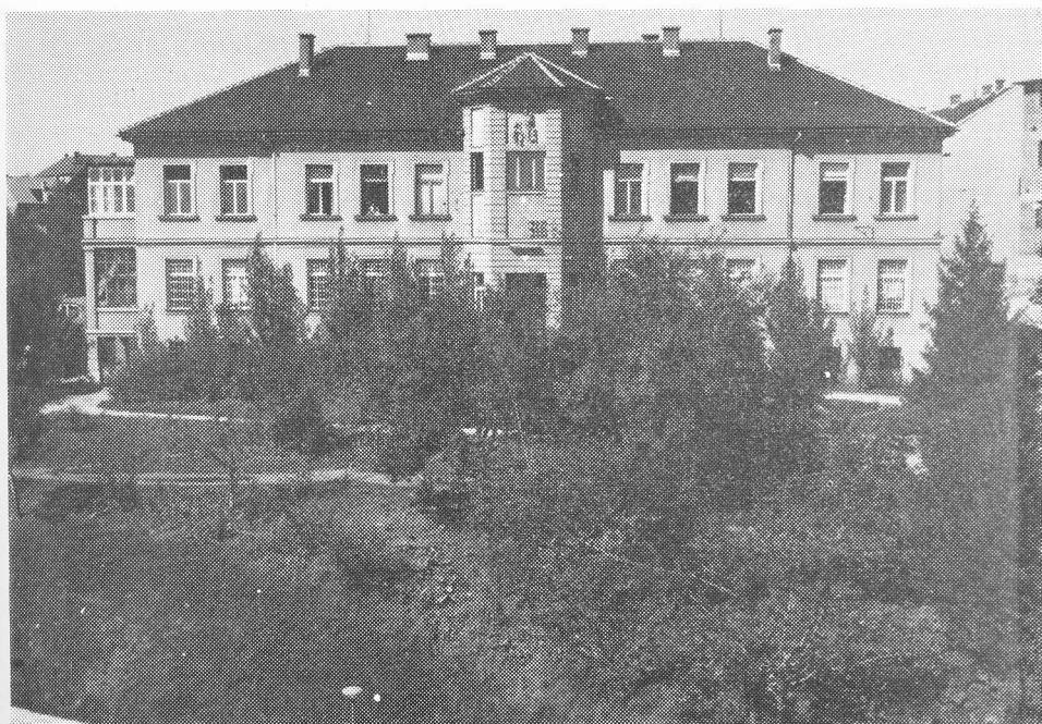
Današnja Klinika za neurologiju, psihijatriju, alkoholizam i druge ovisnosti snimljena oko 1960, prije adaptacije potkrövlja.