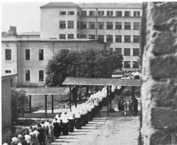
Bolnica neposredno nakon drugog svjetskog rata s natkritim hodnicima između zgrada, kad su njima često šuš kale haljine milosrdnih sestara.