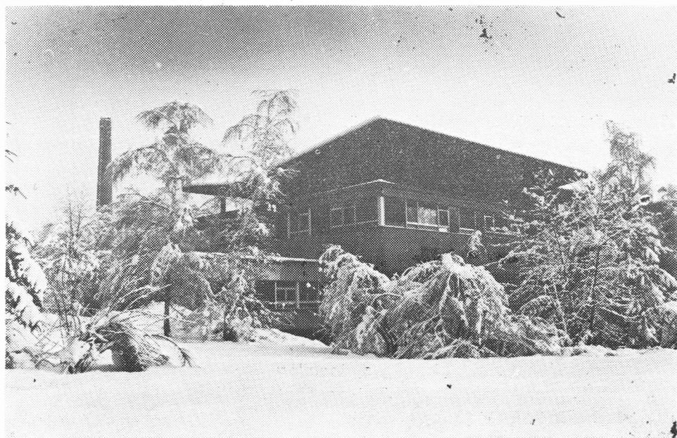
Novi kirurški operacijski trakt u zimskom ruhu, 1955. godine.