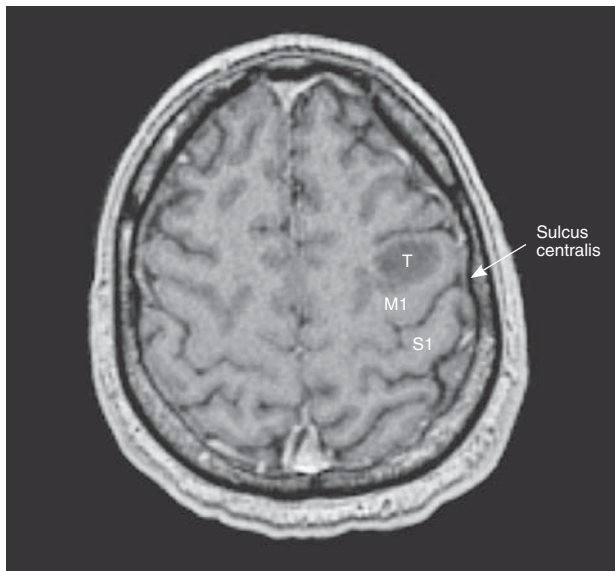
T – tumor; M1 – motorička regija/primary motor region; S1 – senzorna regija/primary sensor region

Slika 1. MR mozga. Aksijalna snimka u T1-vremenu nakon aplikacije kontrastnog sredstva. Vidljiva je tvorba veličine 18 \times 14 \times 16 mm, niskog intenziteta signala i bez patološke imbibicije. Strjelica pokazuje položaj centralne brazde (sulcus centralis)